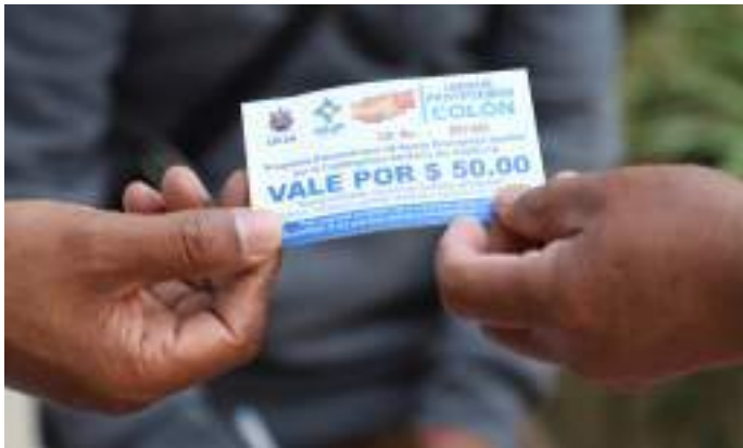
Fuimos precursores en el diseño e implementación de una política social dirigida a las familias económicamente afectadas.

La implementación del programa “Unidos Protegemos Colón” ha resultado en la entrega de vales canjeables por productos de la canasta básica en beneficio de la economía de las familias y de los pequeños comerciantes locales.