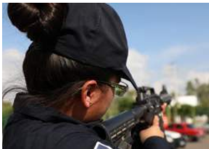
La salvaguarda de la integridad ciudadana exige de un buen entendimiento entre instituciones y autoridades de seguridad pública.