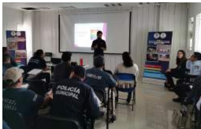
Creamos esquemas de coordinación con organismos públicos especializados para mejorar, el desempeño público.