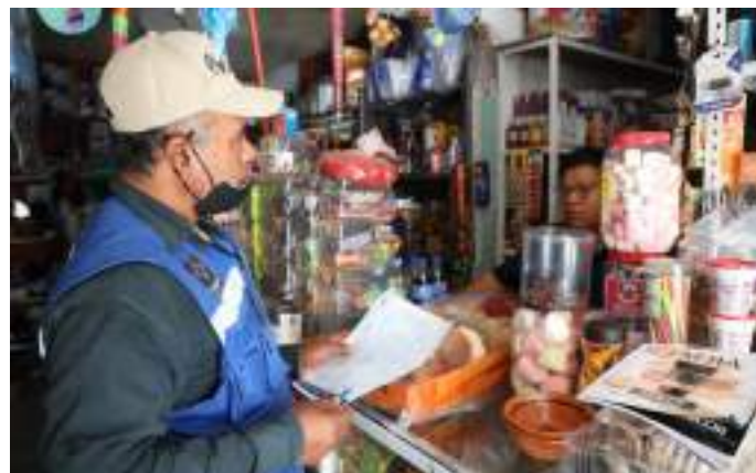
Inspeccionamos comercios locales esenciales para cuidar de la salud de los consumidores.

Se informó del protocolo de prevención y medidas sanitarias a 600 comercios establecidos, mismos que recibieron visitas de inspección subsecuentes para su vigilancia.