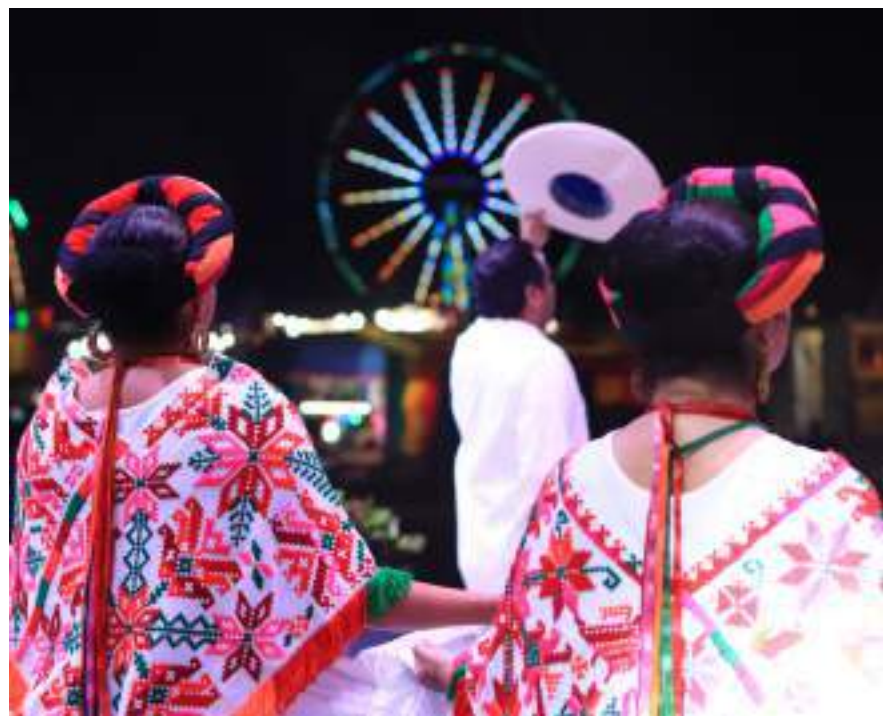
A la par de la cartelera artística, promovimos la riqueza histórica y cultural de Colón en la Feria de la Raza 2019.

Durante la Feria hubo un aforo total de 50,000 personas.