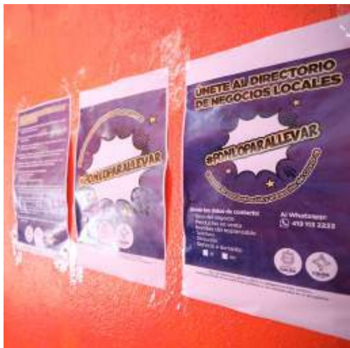
El padrón está conformado por 177 negocios.

De acuerdo con la evaluación de un porcentaje “muestra” del 25% (40 negocios) entre los participantes se conoció que las ventas se mantuvieron cerca del 80% de la normalidad. En comparación con la media nacional que se ubica en el 50%. En tal sentido, podemos afirmar que, resultado de la aplicación de la estrategia, los negocios participantes mejoraron sus ventas en un 30%.