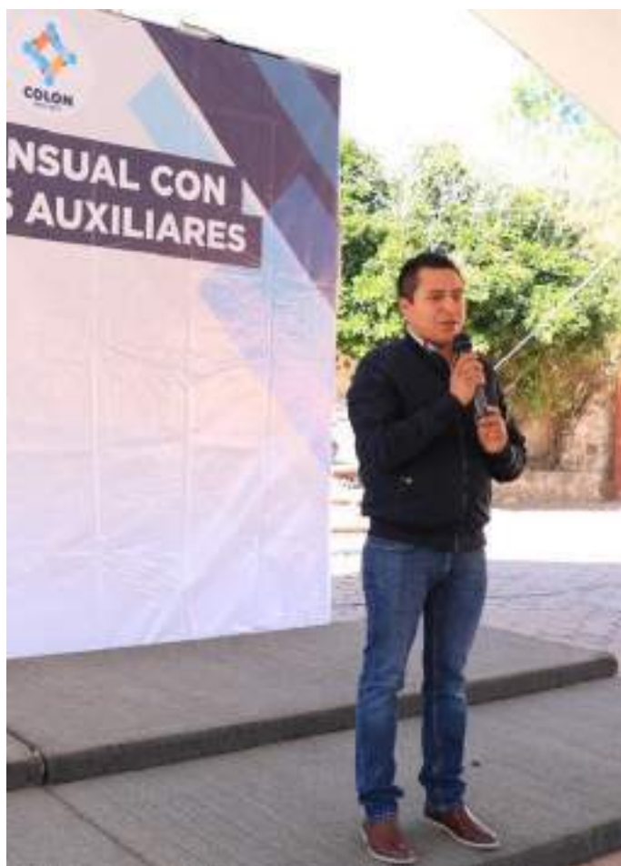
Bajo las directrices de un gobierno abierto, incluimos a autoridades civiles y auxiliares en la toma de decisiones públicas.

Al ser una administración que formula sus políticas y estrategias públicas de cara a las necesidades del ciudadano, a través de las autoridades auxiliares -que son la primera autoridad de contacto con el ciudadano- se han realizado 43 reuniones de trabajo con el fin de consultar y construir soluciones inmediatas a los problemas públicos, además de la aplicación de ejercicios de planeación para el desarrollo municipal que propicie el acceso integral y sostenible al bienestar de las familias colonenses.