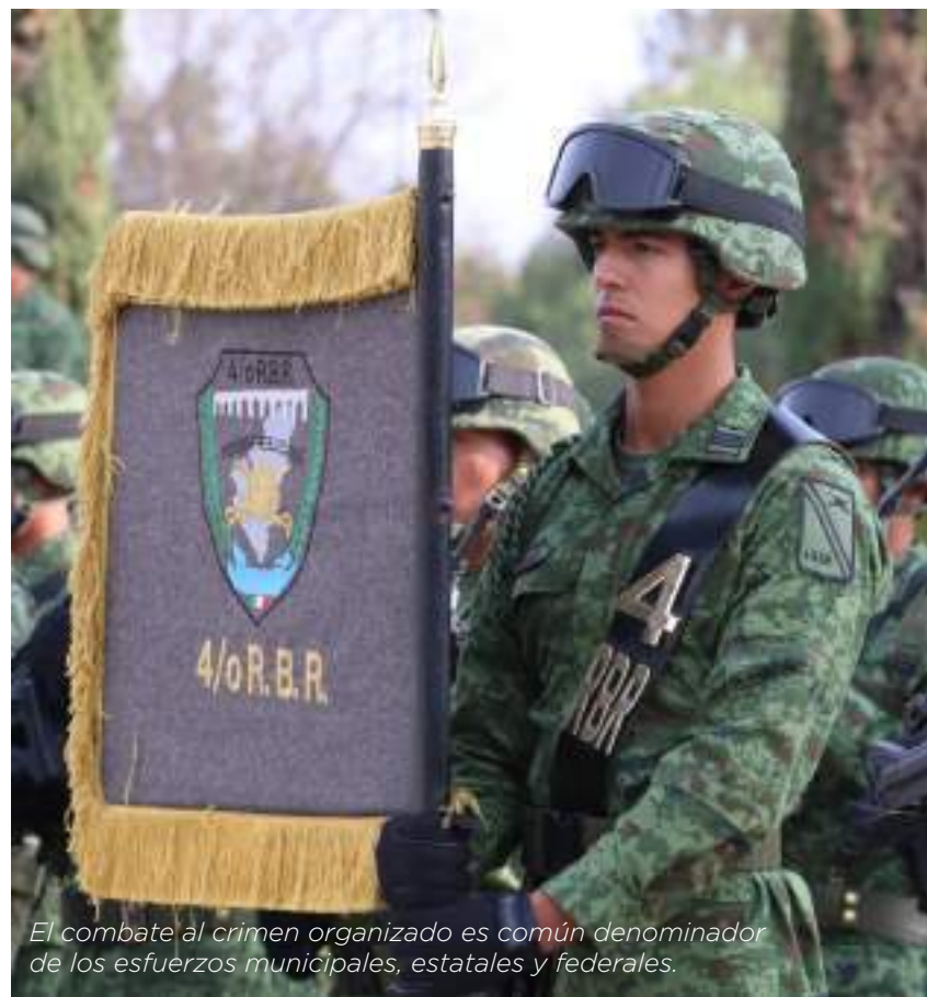
El combate al crimen organizado es común denominador de los esfuerzos municipales, estatales y federales.

Con la implementación del programa Colón Seguro a través de tareas articuladas con la Secretaría de la Defensa Nacional -17/a Zona Militar-, la Guardia Nacional y el operativo inter-policial de cinco municipios se brindó atención oportuna a delitos contra la salud en su modalidad “posesión de narcóticos” (16 personas aseguradas); portación de armas de fuego (cinco armas de uso exclusivo del Ejército aseguradas); robo a lugar cerrado (cuatro personas aseguradas); robo de vehículos (17 vehículos asegurados) y distintos hechos constitutivos de delitos (26 vehículos asegurados).