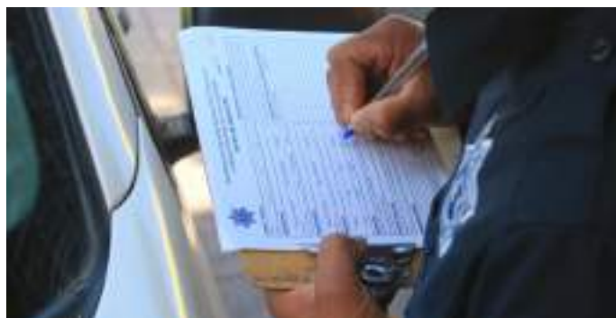
Trabajamos con responsabilidad y disciplina para promover el cuidado del conductor.