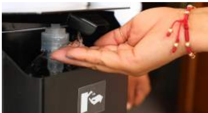
Aportamos insumos y dispusimos de personal para la vigilancia de las medidas sanitarias en espacios públicos.

Se informó del protocolo de prevención y medidas sanitarias a 600 comercios establecidos, mismos que recibieron visitas de inspección subsecuentes para su vigilancia.