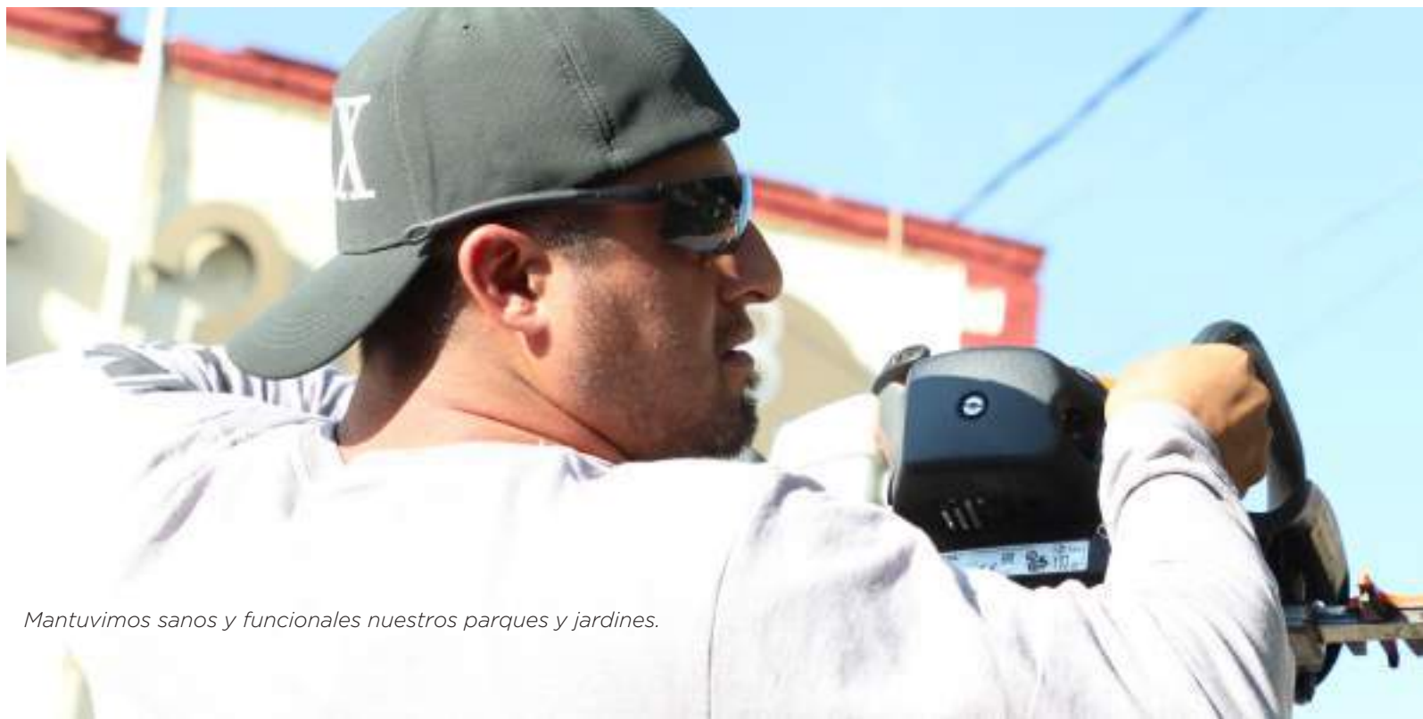
Mantuvimos sanos y funcionales nuestros parques y jardines.

Se brindaron ocho viajes de agua (80,000 litros) para