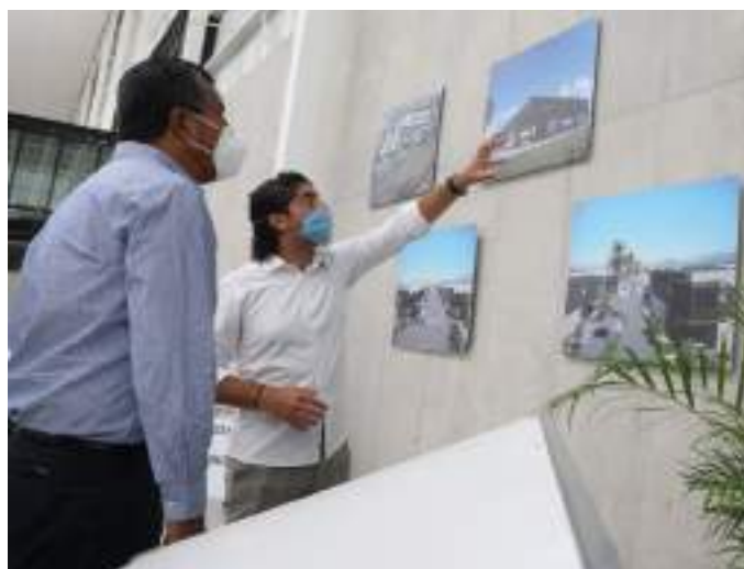
La instalación de parques industriales representa el surgimiento de nuevos y fuertes indicadores para el desarrollo.