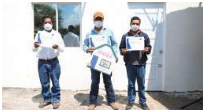
Trabajamos en equipo para garantizar el derecho a la vivienda de 248 familias colonenses.

Aunado a ello, se gestionó una bolsa económica de 45 millones 519 mil 525 pesos mediante aportaciones de los beneficiarios, Gobierno del Estado y la federación. Recursos con los que se construyeron 248 viviendas en 34 comunidades, 65 baños en 16 comunidades y 213 pisos firmes en 19 comunidades.