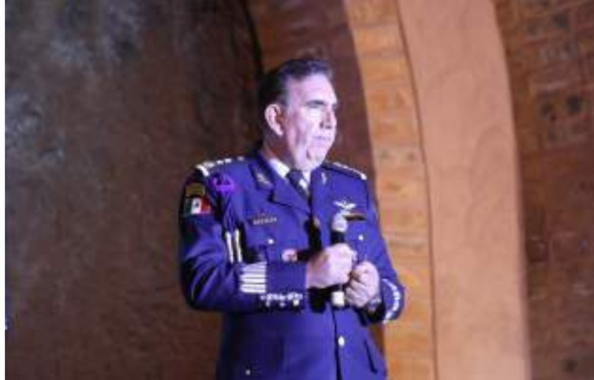
Articulamos tareas para encaminar la Feria Aeroespacial México 2021 al éxito en inversión y encuentros de negocios.

El Municipio de Colón estuvo presente en el Seminario de Inversión Extranjera donde se colocó como