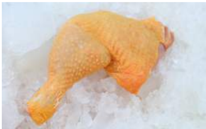
Miles de familias obtuvieron alimentos de la canasta básica con descuentos especiales para hacerlos accesibles.

Con una variada oferta de carne de res y de puerco, se distribuyeron 4,731 kilogramos de carne entre las 53 comunidades del Municipio de Colón.