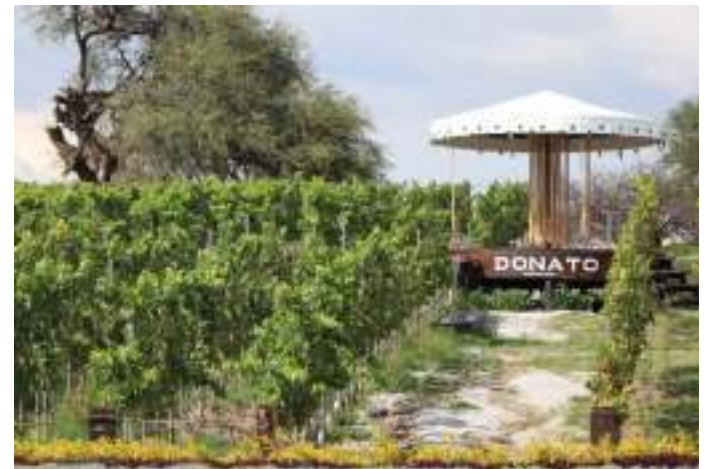
Adoptamos los objetivos de la estrategia estatal Ruta del Arte Queso y Vino.

Ruta Arte, Queso y Vino: Incluye Haciendas, Quebrías y Vinícolas