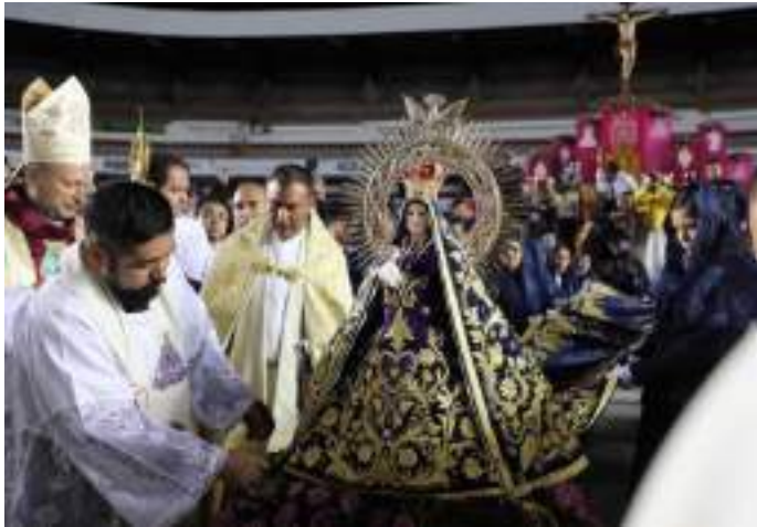
Participamos activamente en eventos que resaltan a Colón como referente del turismo religioso.

Clausura del Año Jubilar Mariano: El lunes 03 de febrero se llevó a cabo la clausura del Año Jubilar Mariano, motivo de gran celebración para la Diócesis de Querétaro y Basílica de Soriano, en el cual se realizó un vasto programa, donde se recibieron más de 5 mil asistentes entre peregrinos y visitantes. Representó una derrama económica significativa para el comercio local, además de proyectar al Municipio como referente del turismo religioso.