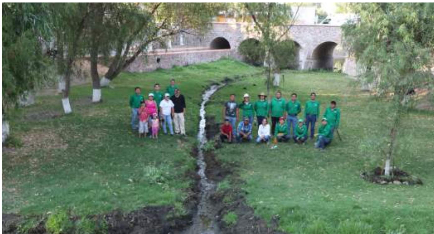
Allanamos y seguimos el camino para convertirnos en un municipio sostenible y resiliente a los cambios climáticos.