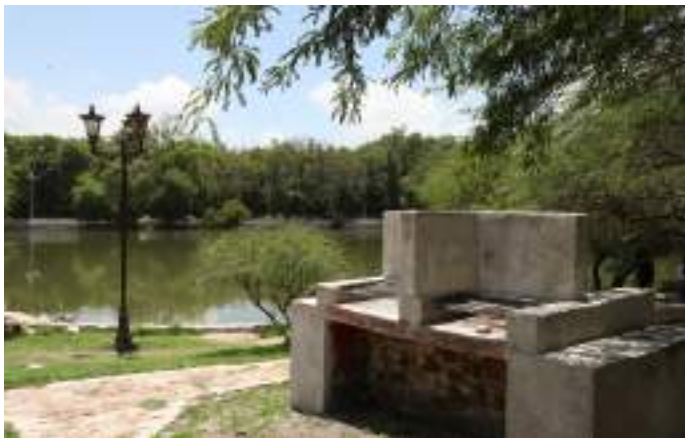
Renovamos la experiencia turística con capacitaciones, adecuaciones a la infraestructura y promoción digital.

Se trabajó en conjunto con Secretaría de Turismo del Estado (SECTUR) para dar a conocer los protocolos oficiales para ser aplicados durante y después de la contingencia que fueron difundidos entre los prestadores de servicios turísticos dentro del municipio para garantizar seguridad e higiene dentro de cada uno de los establecimientos.