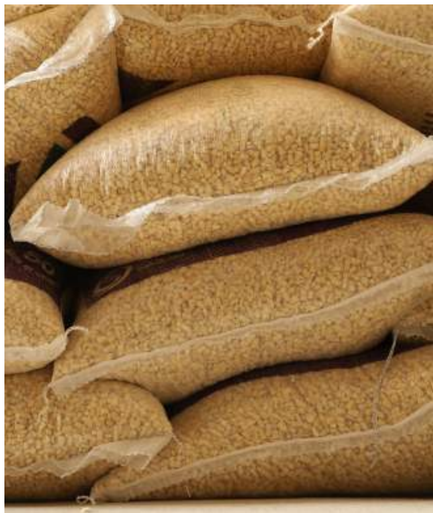
Abarcamos alimentos elementales para la nutrición como maíz, huevo, leche, pollo y carne.

En medio de los retos económicos que acarreó la presencia de la epidemia de Covid-19 en el estado de Querétaro, en el Municipio de Colón pusimos a disposición de los productores la gratuidad en el flete y la aplicación de descuentos en la adquisición de pacas de avena, alfalfa y zacate; así como en la adquisición de alimento para ganado, y de engorda para ovinos y bovinos.